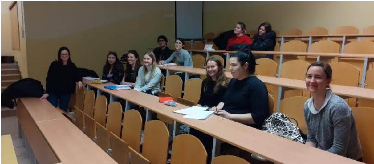
Uvodni sestanek s študenti