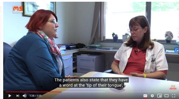
Kako svojci prepoznajo motnje pozornosti pri obolelem z MS in kaj narediti?