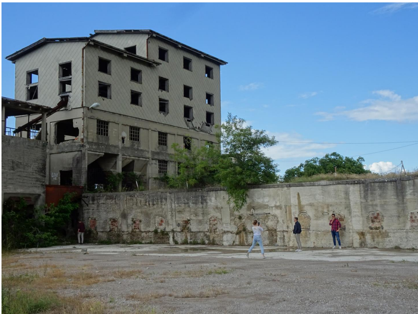
Slika 4: Opušeni objekti rudnika premoga v Sečovljah, preverjanje obstoječega stanja