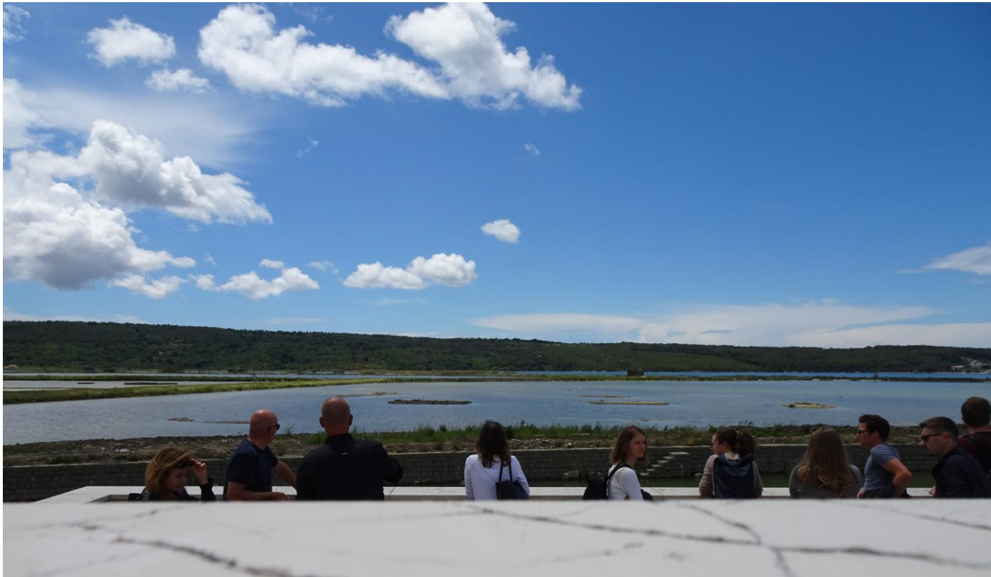
Slika 2: Z ekskurzije v Sečoveljske soline