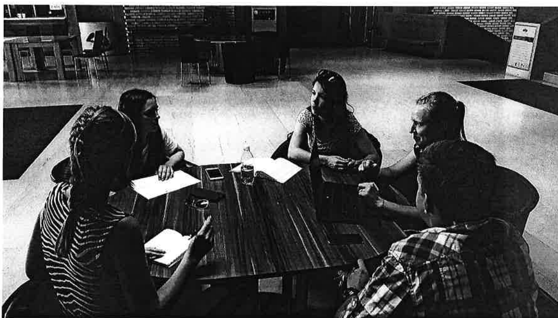
Slika 2: Študenti pri delu na projektu